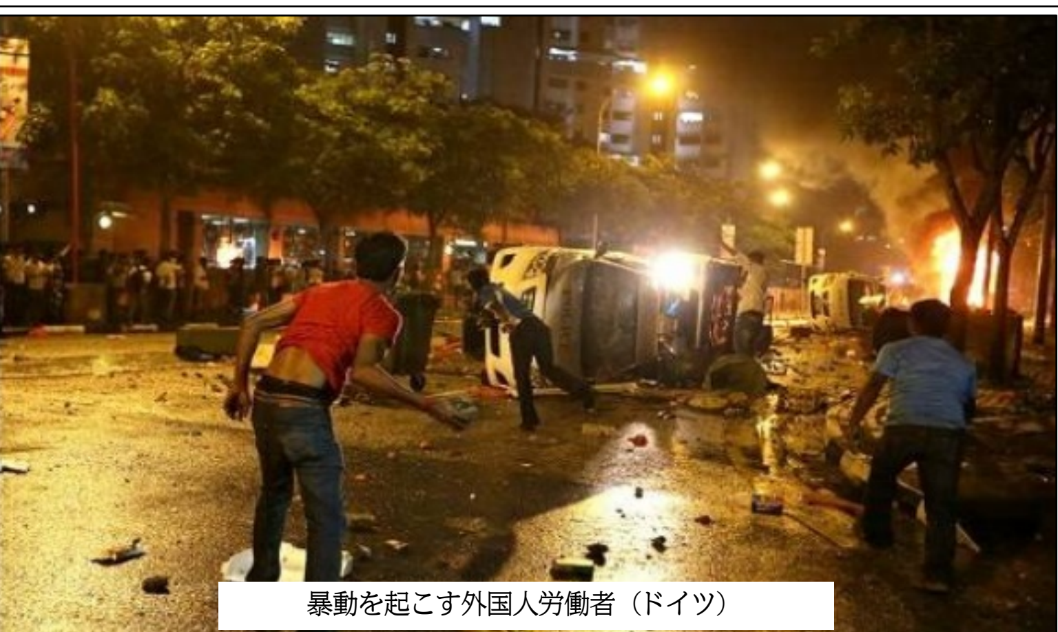
暴動を起こす外国人労働者（ドイツ）

入国管理局は、外国人労働者の受入れを促進し、国内産業の発展に貢献することを期待している。入国管理局は、外国人労働者の受入れを促進し、国内産業の発展に貢献することを期待している。